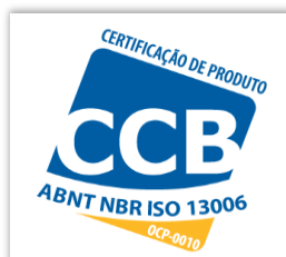
CERTIFICAÇÃO DE PRODUTO